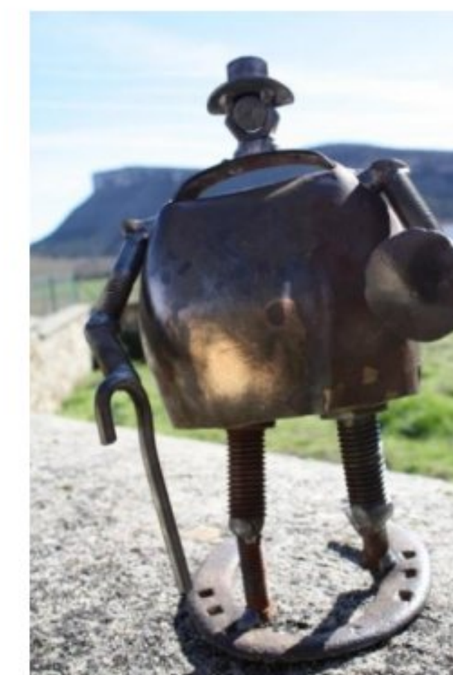
(Figuras de la exposición del año 2015)